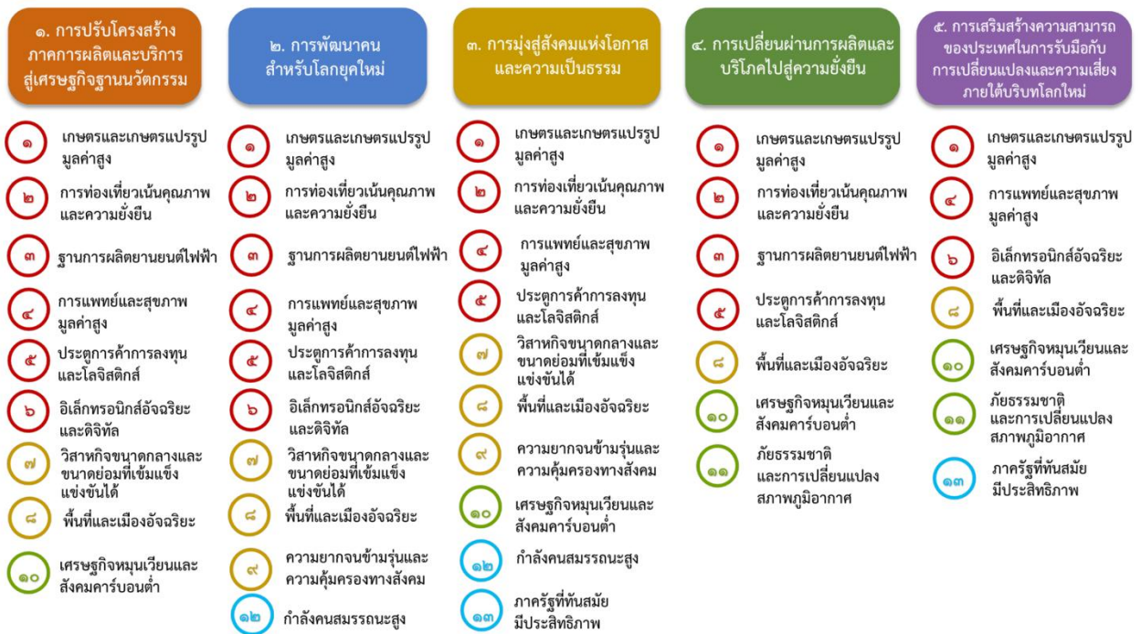
ภาพที่ ๒.๑ แผนภูมิภาพแสดงความเชื่อมโยงระหว่างหมวดหมู่การพัฒนา กับ เป้าหมายหลัก

ทั้งนี้ สามารถสรุปความเชื่อมโยงระหว่างแผนพัฒนาเศรษฐกิจและสังคมแห่งชาติฉบับที่ ๑๓ กับกองทุนพัฒนาการกีฬาแห่งชาติ ได้ว่า แผนพัฒนาเศรษฐกิจและสังคมแห่งชาติฉบับที่ ๑๓ มุ่งพลิกโฉมประเทศไทยสู่ “สังคมก้าวหน้า เศรษฐกิจสร้างมูลค่าอย่างยั่งยืน” ผ่านกรอบเป้าหมายหลัก ๕ ประการ และหมวดหมู่การพัฒนาจำนวน ๑๓ หมวดหมู่ ซึ่งมีความเชื่อมโยงอย่างเป็นรูปธรรมกับบทบาทและภารกิจของกองทุนพัฒนาการกีฬาแห่งชาติ ในหลายมิติ โดยเฉพาะในด้านการส่งเสริมสุขภาพ การพัฒนากำลังคน และการผลักดันอุตสาหกรรมกีฬาสู่เศรษฐกิจฐานใหม่ของประเทศ